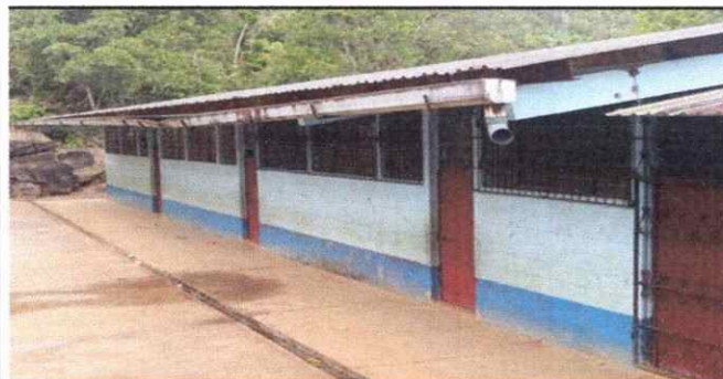
Foto 5: Se deterioraron los canales y se quebraron los pescantes por el pasar de los años.