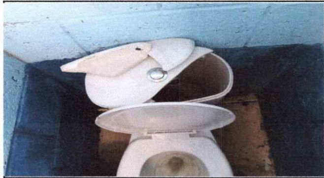
Foto 7: Las tapaderas de los depósitos de agua se han dañado, los accesorios se dañaron eso hace que ya no exista agua en los depósitos de los inodoros