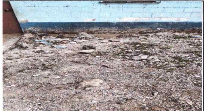
Foto 8: los muros perimetrales frontales del establecimiento se han deteriorado mucho y eso hace que perros, animales de corral lleguen a diario y es de encontrar estiércol de animales todos los días