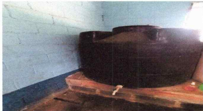
Foto 9: la necesidad del vital líquido hace que sigamos utilizando estos depósitos que ya no cuentan garantía para almacenar agua para su uso escolar, se sustituirán las existentes.