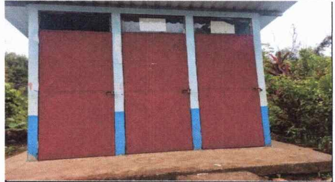
Foto2: Las puertas de los baños ya no cierran y abren correctamente porque el marco se desatornilló, se quebraron los pasadores para el cierre correcto y se hará el mantenimiento de las 3 puertas.