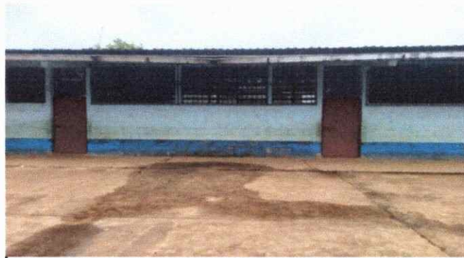
Foto 3: Se hará mantenimiento a las puertas de metal, así mismo se colocarán fijadores a los marcos de dos puertas de la sala de maestros ya que carecen de seguridad.