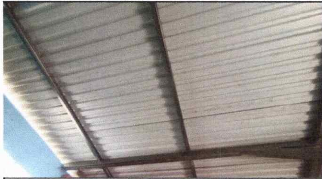
Foto 1. Se hará un corte a las costaneras y vigas para levantar un poco la estructura metálica y tener salida de humo.