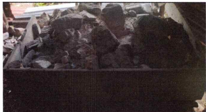
Foto 10: Se procederá a mejorar esta estufa rural a una mejor con estructura bien definida